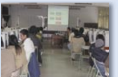
上機情形