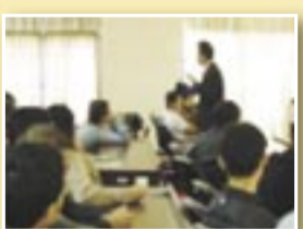
新世紀運籌變革管理研討會報到與上課情況