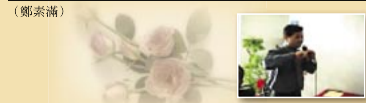
(鄭素滿) 鄭素滿 攝影