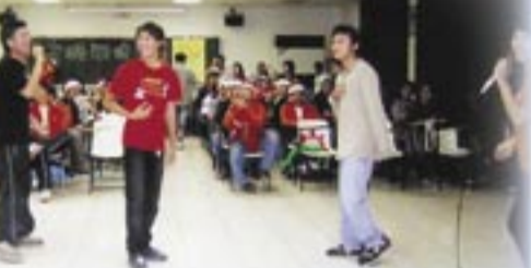
金機回娘家