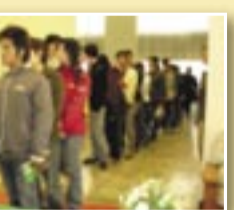
財務管理e化班結訓典禮