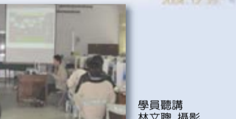
學員聽講