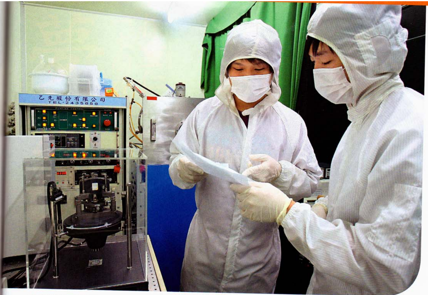
虎尾科技大學就業率高達 99.54%，為科技大學第一名。